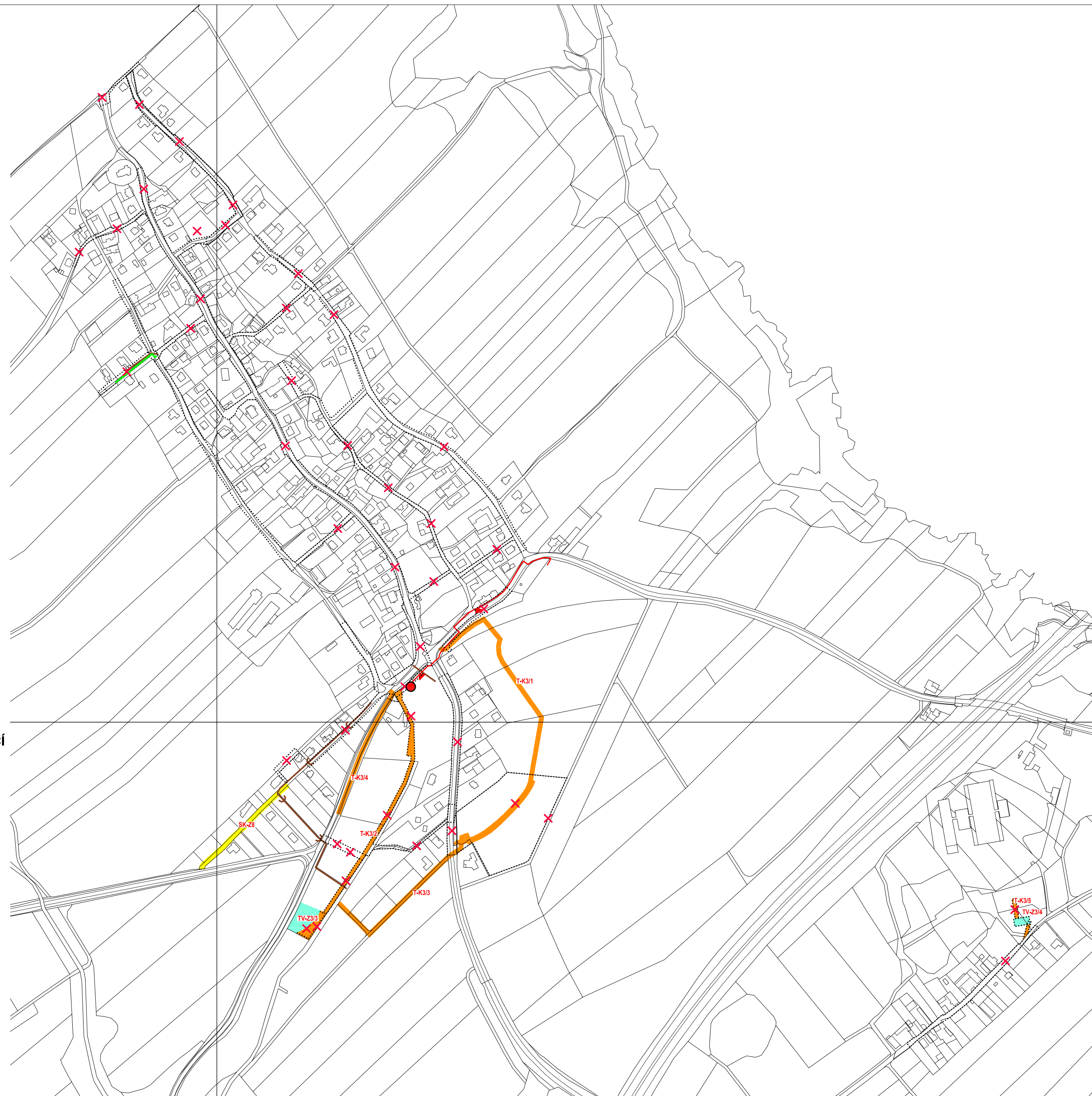
KLAD MAPOVÝCH SEKCI MĚŘÍTKA 1:5000

POZNÁMKA: – V RÁMCI ZMĚNY Č.3 ÚP SE RUŠÍ POLOŽKY LEGENDY "POŽADAVEK NA AKCEPTACI PROSTUPU (UMÍSTĚNÍ) TECHNICKÉ INFRASTRUKTURY (KANALIZACE, VODOVOD, PLYNOVOD, APOD.) V PLOŠE", "PLOCHA DOTČENÁ POŽADAVKEM NA AKCEPTACI PROSTUPU STAVEB PRO TECHNICKOU INFRASTRUKTURU (STAVBY BUDOU UPŘESNĚNÝ V RÁMCI ZPRACOVÁNÍ PODROBNĚ DOKUMENTACE)".